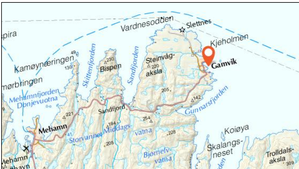
Figur 1. Planområdet, markert med oransje markør, ligger i og rundt havnebassenget i Gamvik, nordøst på Nordkinnhalvøya.